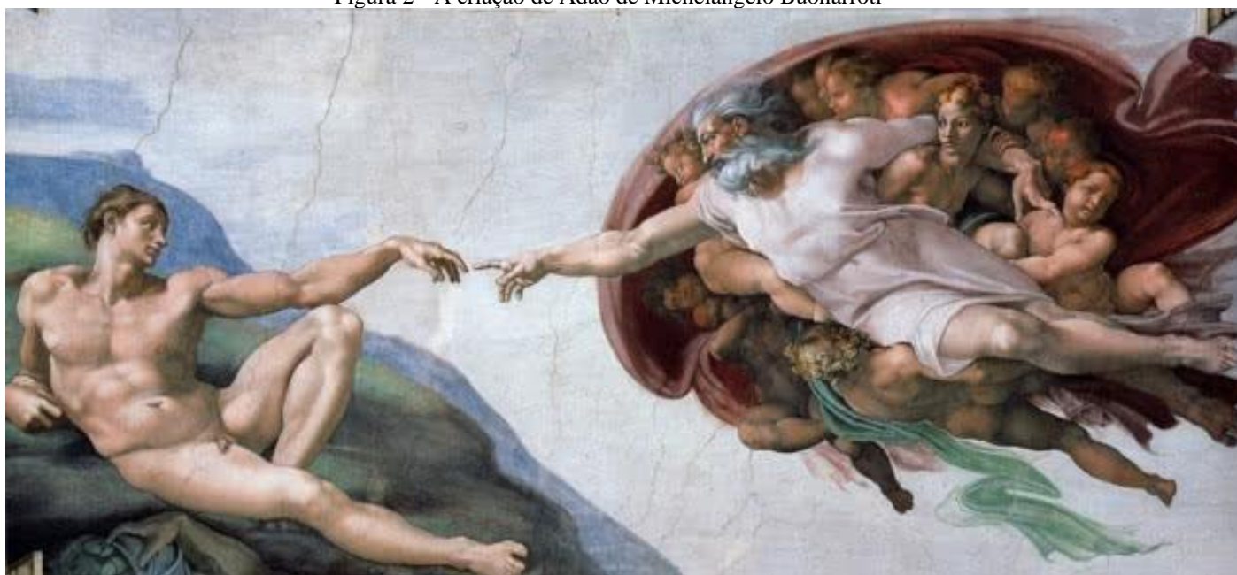
Figura 2 - A criação de Adão de Michelangelo Buonarroti